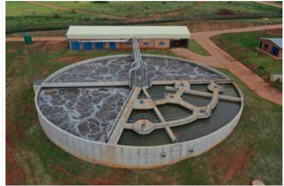
Die Koster-rioolverwerkingsaanleg.

Wat tans met die munisipaliteit Kgetlengrivier (wat Koster, Swartruggens en Derby insluit) gebeur, is in die klein wat met Suid-Afrika aan die gebeur is.